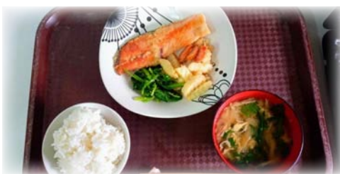
サーモンのバター焼き、春菊のおみそ汁

サーモンのバター焼きとホウレン草のごまあえ 春菊のおみそ汁、春菊にはβカロテンの含有量がとても多くビタミンC、カルシウム、鉄分なども豊富です。