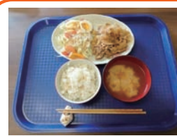
しょうが焼き定食