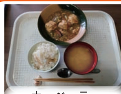
ナーベラー チャンプルー

久しぶりのナーベ ラーチャンプルーが 美味しい！ビタミン ミネラル、食物繊維 など多くの栄養素 含まれ、生活習慣 病予防にもなる 最高な一品。