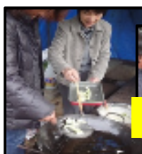
交流の日(祝日開催) 訪問歓迎