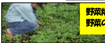
野菜畑と野菜の出荷